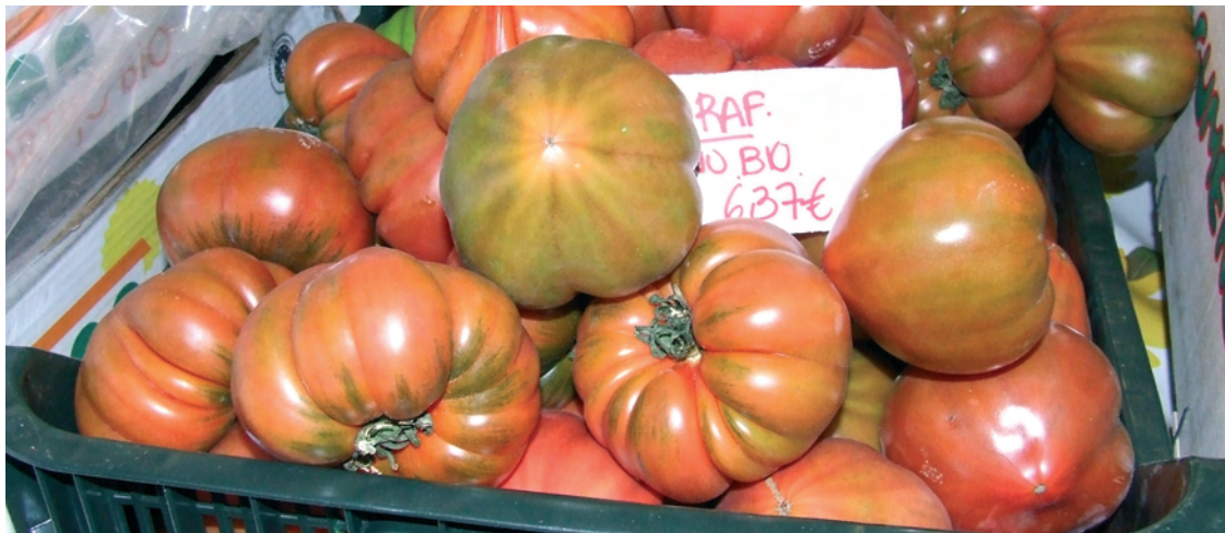
Las distintas marcas han tenido un período de adaptación para cumplir la norma comunitaria.

Sea como sea, de todo corazón, Bienvenidos!